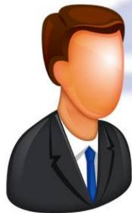
Abogados y Procuradores

59,6% son hombres . 36 años en promedio. 4,9% declara pertenecer a algún pueblo indígena . 59,2% es abogado(a) titulado(a) . 1,4% declara tener alguna discapacidad física . 98,6% es chileno(a) . 56,8% vive en la misma comuna del Tribunal y un 96,9% en la misma región .