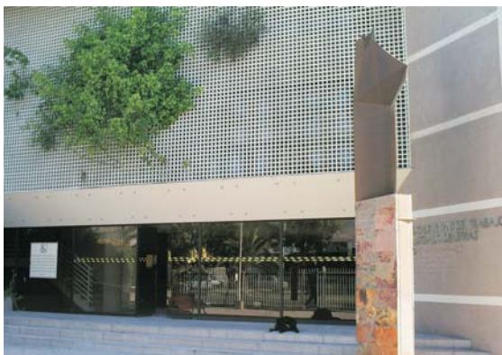
Frontis del edificio en donde se encuentra el tribunal en Copiapó.

Por estos días se encuentran realizando las últimas reuniones de coordinación, también en un diálogo fluido con la Corporación de Asistencia Judicial, la Inspección del Trabajo, las empresas de cobranza y los receptores judiciales. Asimismo, están finalizando los cursos de capacitación. En Copiapó, el nuevo tribunal está emplazado en el primer piso del edificio donde también se encuentran el Tercer y el Cuarto Juzgado de Letras de la jurisdicción y se trabaja arduamente. "Nuestro ánimo es muy positivo, pese a que los plazos para tener todo