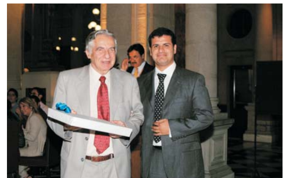
El ex ministro Marcos Libedinsky recibe un reconocimiento por su trabajo en la Corporación.