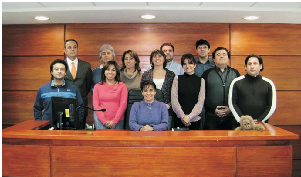
La magistrado del juzgado del Trabajo de Punta Arenas junto a su equipo.

de Asistencia Judicial y de la Inspección del Trabajo.