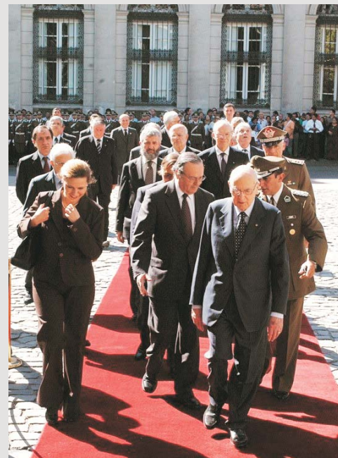
El mandatario italiano Giorgio Napolitano ingresa al Palacio de Tribunales.

Para mediados de abril se espera la visita de la presidenta de la República de India, la abogada Pratibah Devisingh Patil, quien fue elegida el año 2007, convirtiéndose en la primera mujer en ocupar ese cargo en ese país.