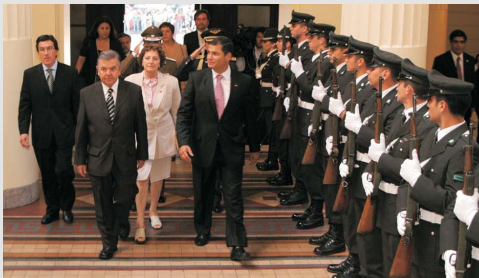
Presidente de Ecuador, Rafael Correa, recibe los honores de Gendarmería.

Ambas reuniones se extendieron por más de 30 minutos y tuvieron carácter protocolar.