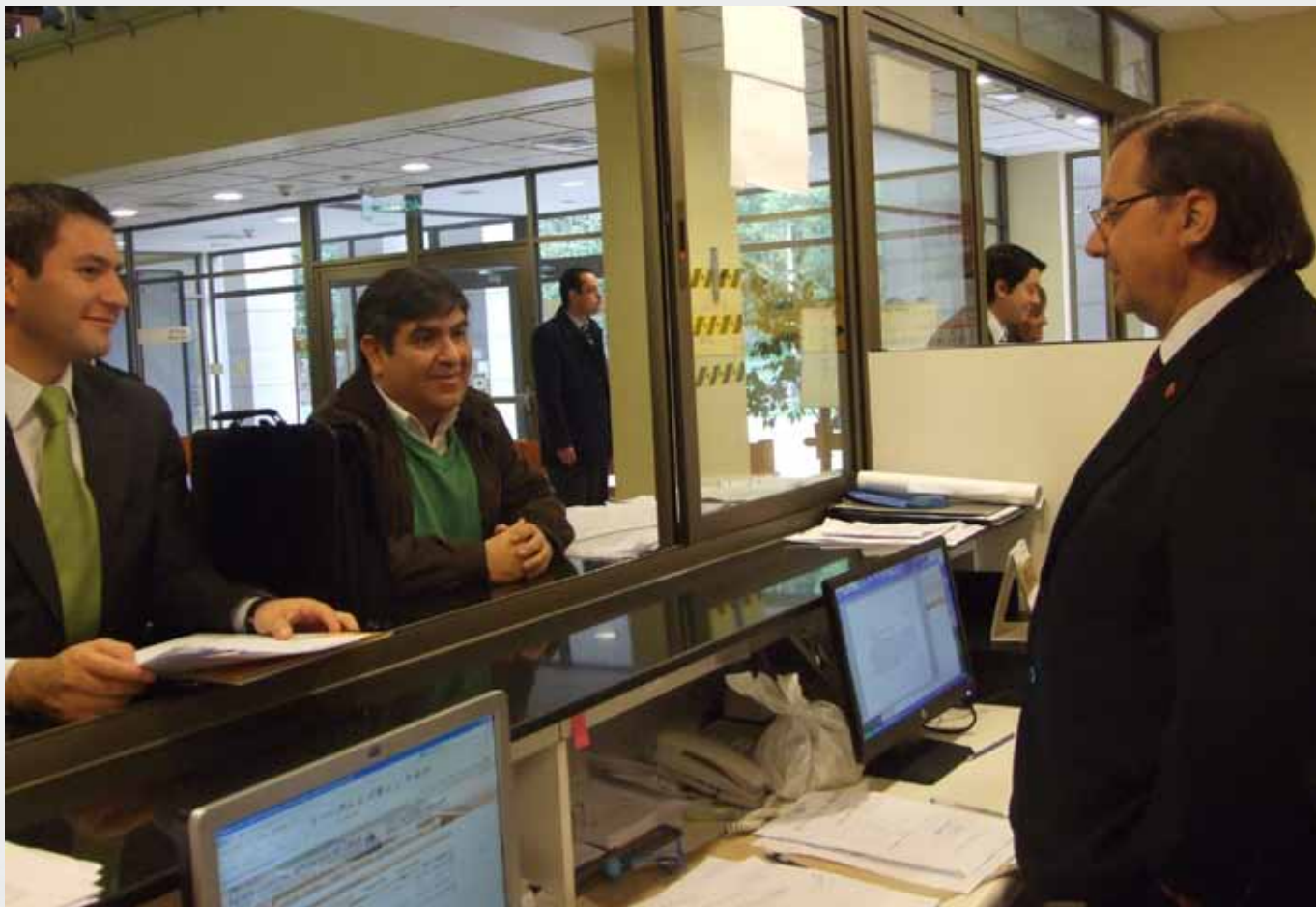
El presidente Ballesteros recorrió las instalaciones de los tribunales, e incluso atendió público en la Corte de Apelaciones de Temuco.